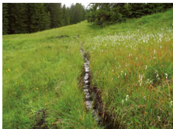
Fig. 2: Fossés de drainage dans un bas-marais d'importance nationale. Dans la partie supérieure du marais, une végétation de bas-marais calcaire est bien développée, typique des Alpes septentrionales; au-dessous du fossé, la végétation typique des bas-marais a cédé la place à une végétation de pâturage humide peuplée d'espèces fréquentes.

Les marais doivent leur existence à un excédent d'eau. Les bas-marais sont alimentés par les eaux de pluie, les eaux de ruissellement et la nappe phréatique; les hauts-marais, quant à eux, ne sont alimentés que par les eaux de pluie. Si le régime hydrique est affecté, les marais en sont modifiés: les espèces végétales typiques, tributaires d'humidité, disparaissent; les hauts-marais s'embroussaillent et de grandes quantités de CO 2 s'échappent dans l'atmosphère, parce que la tourbe, qui n'est plus saturée d'eau, se décompose. Ainsi les hauts-marais de-